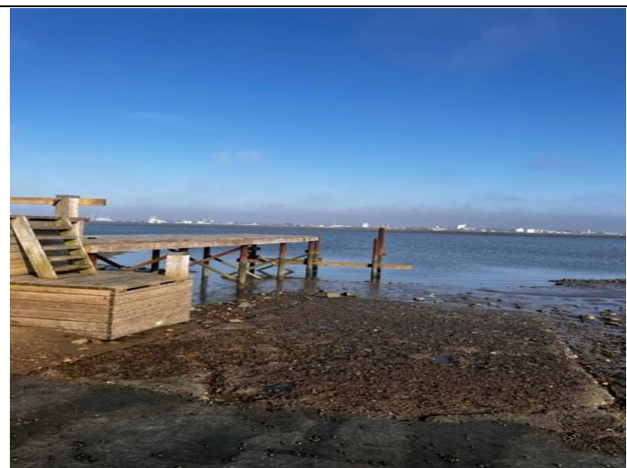
Næsten færdig, oktober 2022.

Sponsor betalingen til Svenskeren udgør 472.150,00 kr. mens udgifterne er ca. 493,605,50 kr. Der er lidt dispute om prisen fra entreprenøren der lavede fundamentet. Det får vi forhandlet på plads i næste uge. Alle omkostningerne og udgifter i forbindelse med projektet betalt, Foreningen Martha har dækker det udestående som ikke er sponsoreret.