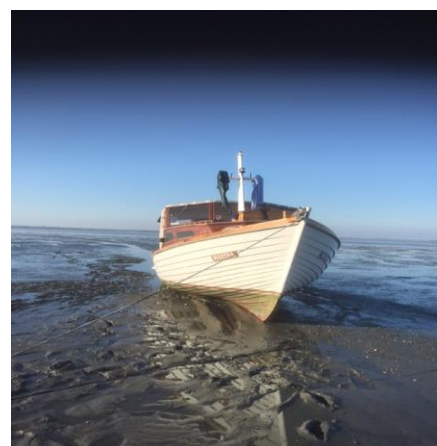
Fejlnavigering på vej til Sønderho.

Der forhandles ligeledes i Sønderho om forhøjning af diget rundt om byen og i forbindelse hermed tilladelse til at benytte noget af det opgravede materiale fra sejlrenden til forhøjning af digerne.