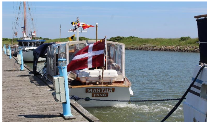
M/S Martha klar til afgang fuldt lastet med passagerer.

Fremgangen skyldes også at det er 3. sæson vi er nu ved at være kendt på vestkysten. Det mærker vi især at mange af passagerne er gengangere samt kommer på endags ture til Fanø for at sejle med Martha. Har især haft henvendelse fra folk der har været i sommerhuse i områderne ved Vejers og Blåvand.